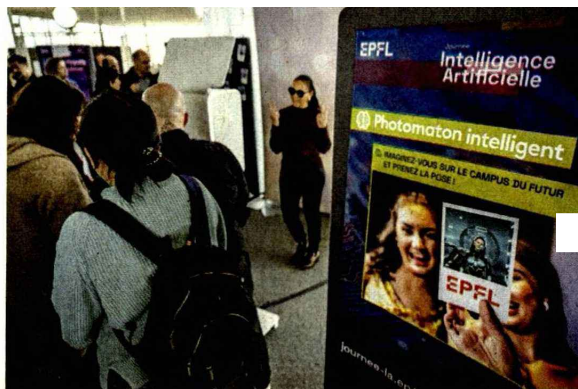
Die ETH Lausanne lud junge Menschen zu einem Tag der Künstlichen Intelligenz ein Symbolbild: Keystone/Jean-Christophe Bott