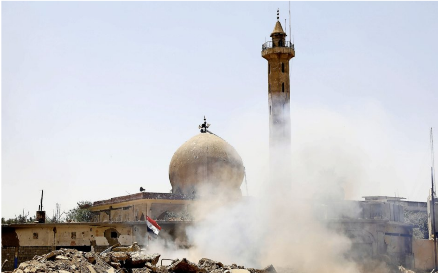
Irak Les forces irakiennes tentent de reprendre les derniers quartiers de Mossoul aux mains du groupe Etat islamique (EI). Selon l'ONU, plus de 750 000 personnes ont quitté leur foyer depuis le début de l'offensive. Quelque 100 000 enfants y vivent dans des conditions extrêmement dangereuses, selon l'Unicef.