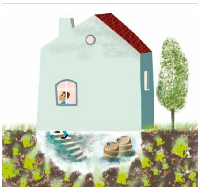
Caves: les défauts d'étanchéité contre le terrain sont les principales causes de l'infiltration du radon dans le bâtiment.

bâtiment, contrairement à celles qui se développent dans le neuf où on les retrouve plutôt dans les pièces humides, au sous-sol qui est un espace en principe non ventilé. Les propriétaires de maisons Minergie surestiment leur présence. Est-ce une marque d'inquiétude de leur part? Il est à noter qu'un grand nombre de personnes ne savent pas ce qu'est une moisissure.»