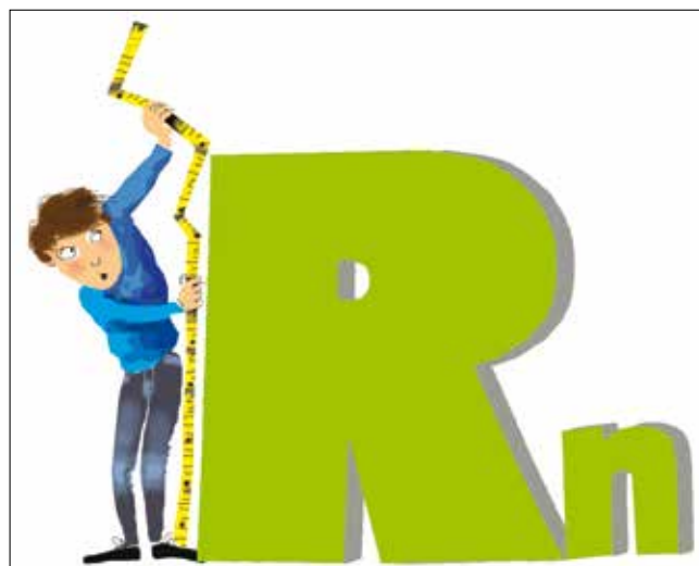
Nécessité de programmer une mesure du radon préalable à la rénovation énergétique voire à d'importants travaux de transformation de l'habitat.

«Dans le cas de la construction neuve, il est nécessaire d'évaluer le risque lié au site mais aussi aux aspects de nature constructive qui seront mis en œuvre dans le futur bâtiment (cave en terrain naturel, type de structure, VMC ou non, etc.). Il n'est pas exclu non plus de prévoir quelques mesures du radon dans le terrain avant construction aux principaux