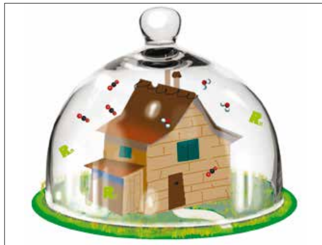
Cloche: problématique de la rénovation énergétique si aucun renouvellement d'air n'est assuré dans le bâtiment isolé.

«Etant donné l'impact de la géologie, des méthodes constructives mises en œuvre mais aussi des conditions de renouvellement de l'air à l'intérieur sur la concentration en radon dans le bâtiment, il est très fortement recommandé d'anticiper ce risque avant tous travaux de construction neuve ou de rénovation énergétique en prenant les mesures qui s'imposent. La réglementation en matière de radon étant sur le point de changer à partir de janvier 2018 avec l'entrée en vigueur de la nouvelle Ordonnance sur la radioprotection (ORaP), nous recommandons aux professionnels de surveiller en fin d'année les recommandations techniques qui seront alors publiées. Certaines recommandations sont d'ores et déjà disponibles sur le site www.ch-radon.ch .»