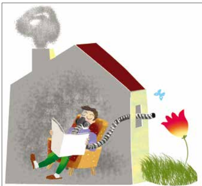
L'air intérieur est plus pollué en moyenne que l'air extérieur.

points d'entrée des réseaux afin de connaître et de prendre en compte le potentiel d'émanation en radon de la parcelle. Dans les régions avérées à haut potentiel d'émanation de radon, il est vivement recommandé d'éviter certains éléments de construction, tels que la cave en terrain naturel, à moins de prendre la mesure de ce risque et de l'intégrer dans la conception du bâtiment. Néanmoins, ce risque potentiel demeure